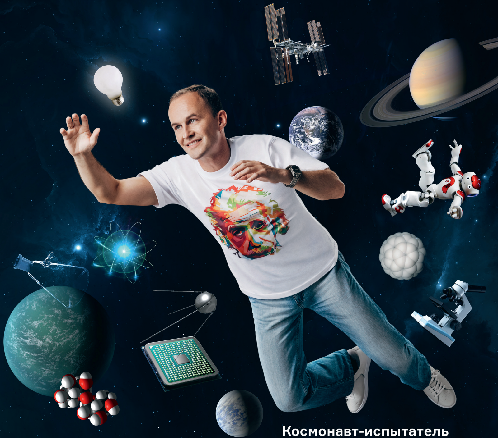
Космонавт-испытатель Сергей Рязанский